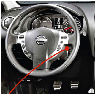
Разъем иммобилайзера на замке зажигания