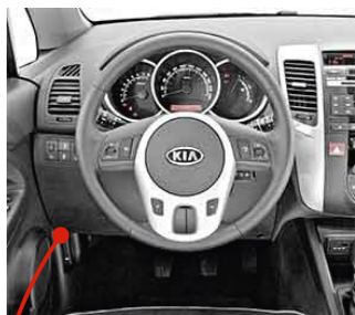
За панелью у левой ноги водителя